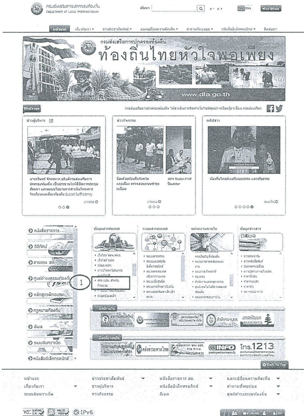
ภาพที่ 1 เว็บไซต์กรมส่งเสริมการปกครองท้องถิ่น

1. เปิดโปรแกรม Web Browser (Google Chrome, Firefox) จากนั้นพิมพ์ URL http://www.dla.go.th เพื่อเข้าสู่เว็บไซต์กรมส่งเสริมการปกครองท้องถิ่น แล้วคลิกเลือกเมนู “รหัส อปท. สำหรับฝึกอบรม” จากหัวข้อ “ข้อมูลสารสนเทศ” ตามภาพที่ 1