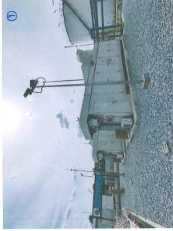
หมายเลข 1 (พื้นที่รวม 730 ตรม.) ประกอบไปด้วย