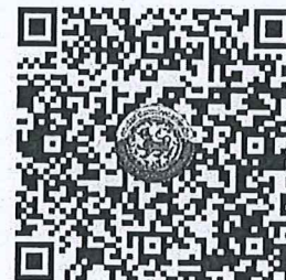
QR Code ๒ ตรวจสอบจำนวนผู้ชำระค่าลงทะเบียนแต่ละรุ่น