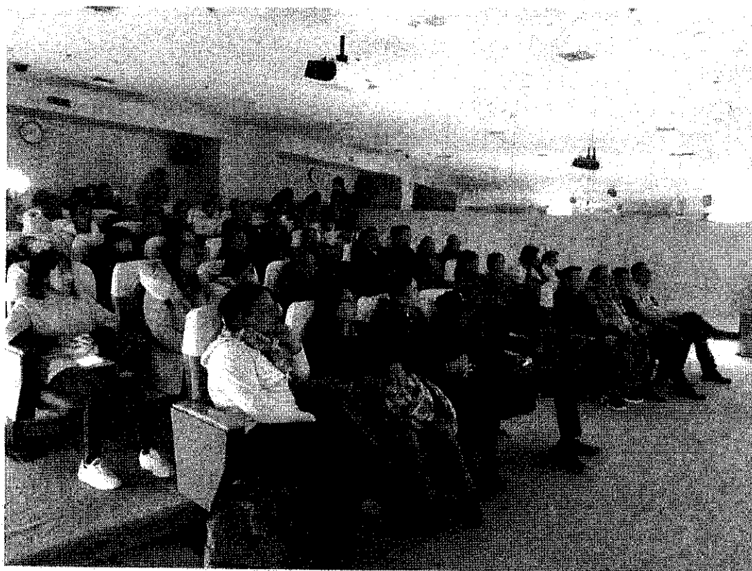
รับฟังการบรรยายสรุป จาก บริษัทเครื่องใช้ไฟฟ้า Haier