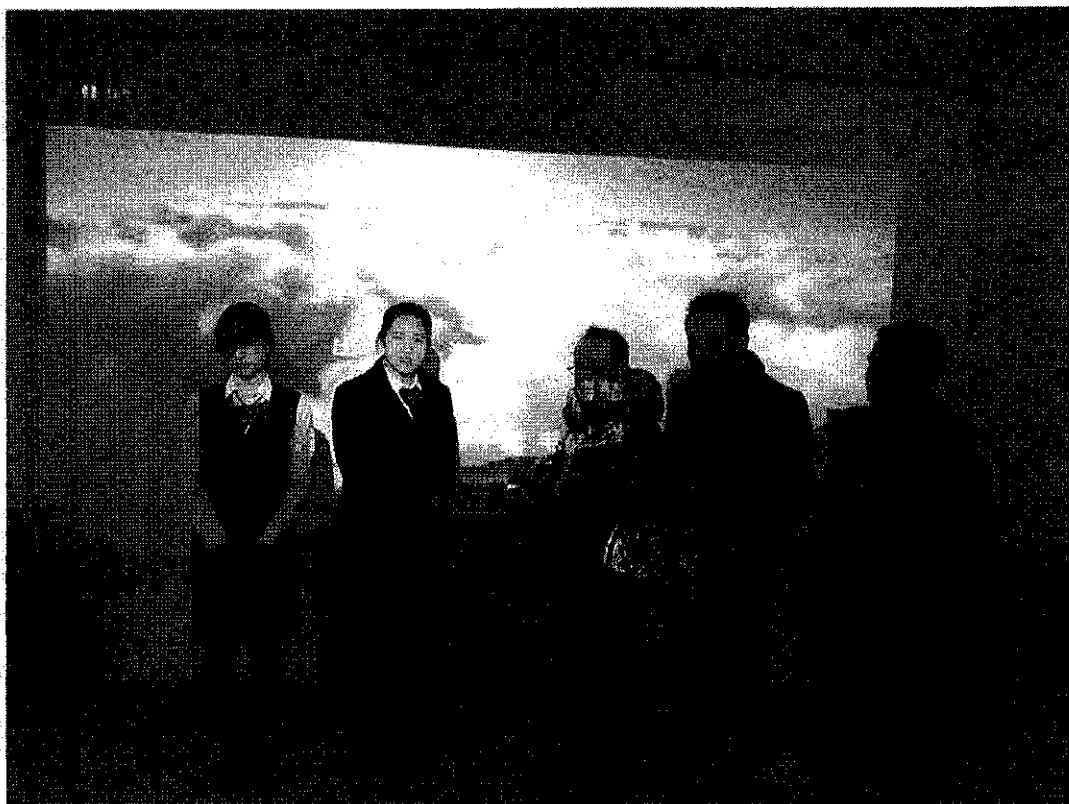
มอบของที่ระลึกแก่เจ้าหน้าที่บริษัทเครื่องใช้ไฟฟ้า Haier ที่มาบรรยายให้รายละเอียด