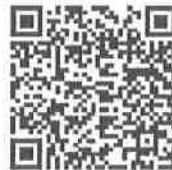
Songkran - Chinese version