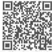
Rum Wang Rarrig Songkran (Bunakaporn Band - English version)