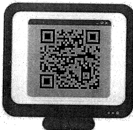
Poster ประชาสัมพันธ์