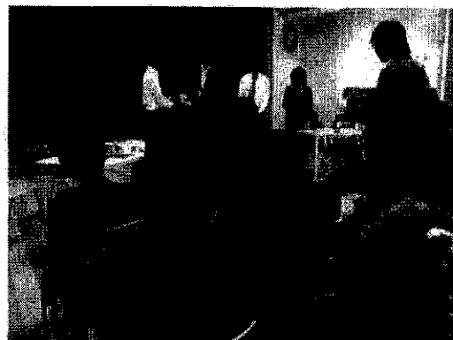
สถานบริการดูแลผู้สูงอายุระยะยาว SEA SIDE YUGAWARA (Elderly Home) เมือง YUGAWARA