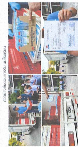
ตัวอย่างใบแจ้งการรับ นมสดโรงเรียน