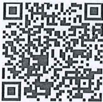
แบบตอบรับ