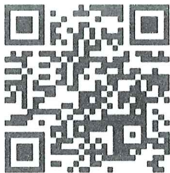
QR Code ตอรับการเข้าร่วมประชุม