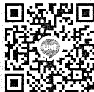
สมัครเข้าร่วมโครงการ