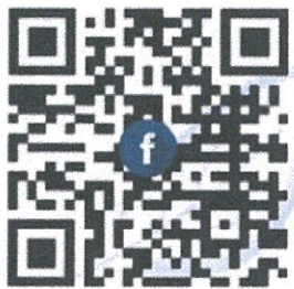
FB ส่นง.คลัง จ.มส

ในวันอังคารที่ ๒๒ มิถุนายน ๒๕๖๔ เวลา ๐๙:๐๐ - ๑๒:๐๐ น.