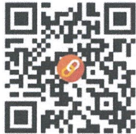
แบบตอบรับออนไลน์

สำนักงานคลังจังหวัดแม่ฮ่องสอน ศาลากลางจังหวัดแม่ฮ่องสอน (หลังเดิม) ถนนขุนลุมประพาส ตำบลจองคำ อำเภอเมือง จังหวัดแม่ฮ่องสอน 58000