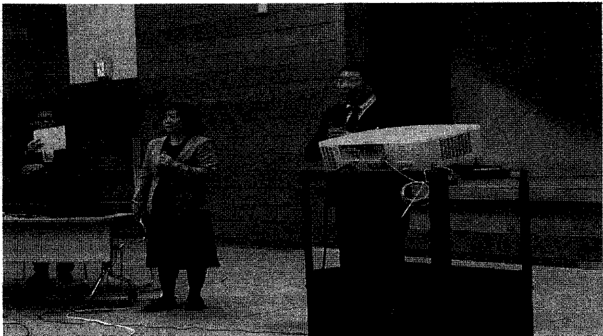
การบรรยายและสาธิตให้ความรู้เทคนิคการดูแลผู้ป่วยคนพิการ ณ สถาบัน JICA (Japan International Cooperation Agency) เมือง Yokohama