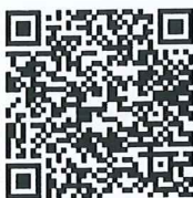
แบบรายงาน