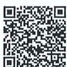
แบบรายงาน