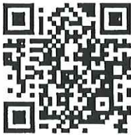
การตั้งชื่อหนังสือ