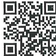
ผลงานเขียน

*** หมายเหตุ : การส่งผลงานจะต้องลงทะเบียนและกรอกข้อมูลทาง QR CODE ที่กำหนด