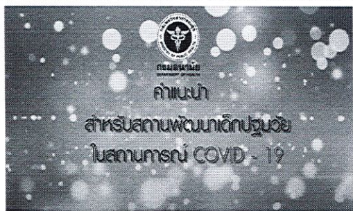
คำแนะนำ สำหรับสถานพัฒนาเด็กปฐมวัย ในสถานการณ์ COVID-19 คลิ๊ก