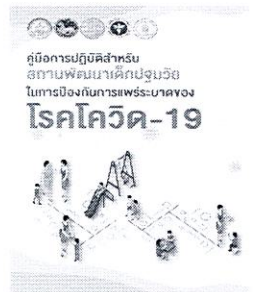
คู่มือการปฏิบัติสำหรับสถานพัฒนาเด็กปฐมวัย ในการป้องกันการแพร่ระบาดของโรคโควิด-19