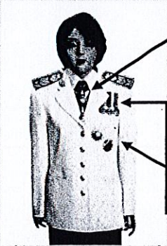
เครื่องแบบเต็มยศและครึ่งยศ (ประดับเครื่องราชอิสริยาภรณ์เหมือนกัน)

เช่น ท.ช., ท.ม. (เดิมประดับหน้าบาเสื้อมีดารา)