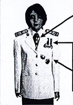
เครื่องแบบเต็มยศและครึ่งยศ (ประดับเครื่องราชอิสริยาภรณ์เหมือนกัน)

เช่น ท.ช., ท.ม. (เดิมประดับหน้าบ่าเสียมิดารา)