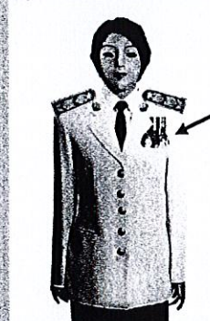
เครื่องแบบเต็มยศและครึ่งยศ

ประดับแพรแถบ เหรียญที่พระราชทานเป็นที่ระลึก ในโอกาสต่าง ๆ แบบบุรุษ ที่อกเสื้อเบื้องซ้าย