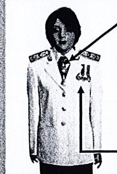
เครื่องแบบเต็มยศและครึ่งยศ (ประดับเครื่องราชอิสริยาภรณ์เหมือนกัน)

เช่น ต.ช., ต.ม. (เดิมประดับหน้าบ่าเสื่อ)