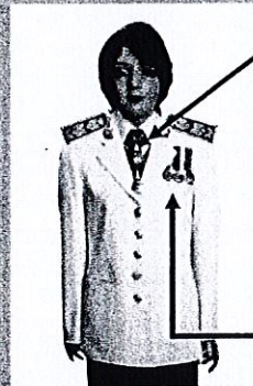
เครื่องแบบเต็มยศและครึ่งยศ (ประดับเครื่องราชอิสริยาภรณ์เหมือนกัน)

ดวงตรา ห้อยกับแพรแถบสวมคอ แพรแถบ ลอดออกจากปกเสื้อตัวใน โดยให้ดวงตรา ทับผ้าผูกคอ และให้ส่วนสูงสุดของดวงตรา จรดเงื่อนผ้าผูกคอ กรณีได้รับพระราชทานมากกว่า 2 ดวง ควรประดับเพียง 2 ดวง ให้ดวงตราที่มีลำดับเกียรติรองลงมา อยู่ต่ำกว่าดวงตราที่มีลำดับเกียรติสูงกว่า เหรียญราชอิสริยาภรณ์ ให้ประดับโดยใช้แพรแถบแบบบุรุษ