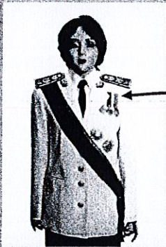
เครื่องแบบเต็มยศ

ประดับดารา ดวงตรา และสวมสายสะพายเช่นเดิม