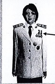
เครื่องแบบครึ่งยศ

เหรียญราชอิสริยาภรณ์ เช่น เหรียญจักรพรรดิมาลา เหรียญที่พระราชทานเป็นที่ระลึก ในโอกาสต่าง ๆ ให้ประดับโดยใช้แพรแถบ แบบบุรุษ