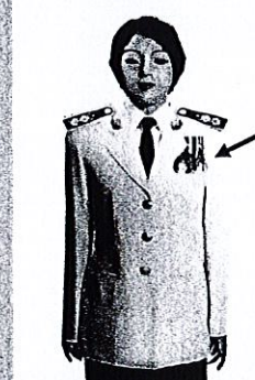
เครื่องแบบเต็มยศและครึ่งยศ

ประดับแพรแถบ เหรียญที่พระราชทานเป็นที่ระลึก ในโอกาสต่าง ๆ แบบบุรุษ ที่อกเสื่อเบื้องซ้าย