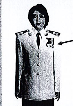
เครื่องแบบเต็มยศและครึ่งยศ (ประดับเครื่องราชอิสริยาภรณ์เหมือนกัน)

เช่น จ.ช., จ.ม., บ.ช., บ.ม., ร.ท.ช., ร.ท.ม., ร.ช., ร.ม.