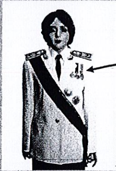
เครื่องแบบเต็มยศ

ประดับดารา ดวงตรา และสวมสายสะพายเช่นเดิม