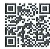
แบบแจ้งรายชื่อ