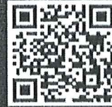
เพลงไทยร่วมสมัย