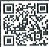
เพลงลูกกรุง

รับสมัครตั้งแต่วันที่ 15 พ.ค. – 15 ก.ค.69