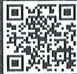
เพลงลูกทุ่ง