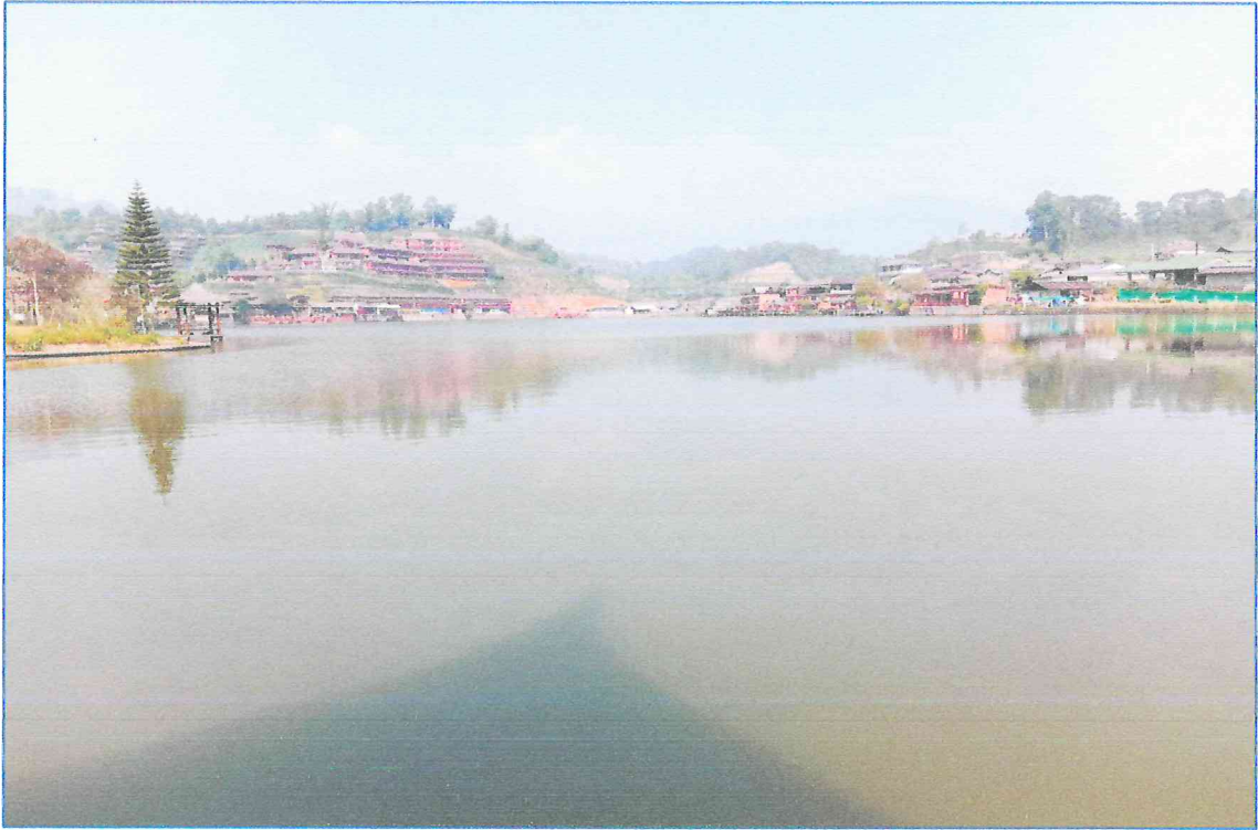
สภาพปัจจุบัน อ่างเก็บน้ำ บ้านรักไทย ก่อนดำเนินการ