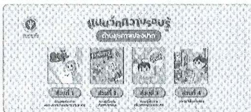
แบบวัดความรู้ด้านสุขภาพช่องปาก