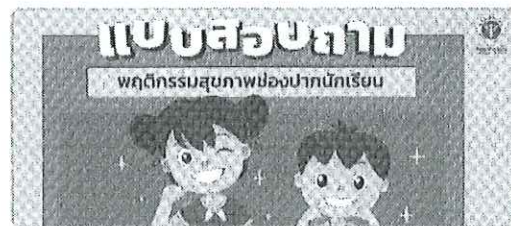
แบบสอบถาม พฤติกรรมสุขภาพช่องปากนักเรียน

วิธีการสมัครเข้าใช้งานระบบ : https://moph.cc/login