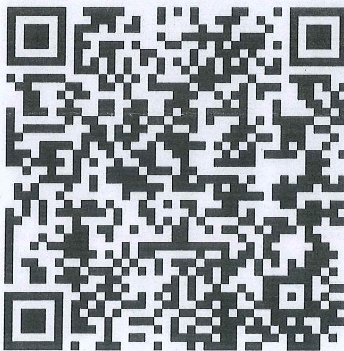
แบบตอบรับ ครั้งที่ ๑