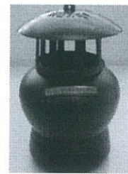
ด้านหลัง