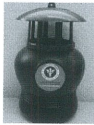
ด้านหน้า