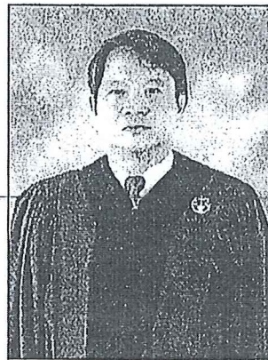
๒. นายตระหง่าน เกียรติศิริโรจน์ อธิบดีศาลปกครองชั้นต้น